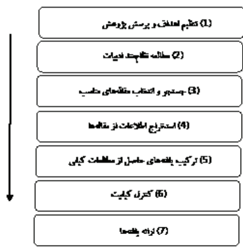
شکل ۲. مراحل و روش کلی فراترکیب (سندلوفسکی و باروسو، ۲۰۰۷)

برای ارزیابی پایایی پژوهش، علاوه بر کدگذاری اولیه محقق، محقق دیگری همان متن را بدون اطلاع از کدهای او و بصورت جداگانه کدگذاری کرده است. در صورتی که کدهای این دو محقق به هم نزدیک باشد، توافق بالا بین این دو کدگذار را نشان می‌دهد که بیان‌کننده پایایی پژوهش است (کریم‌میان و همکاران، ۱۳۹۸، ۳۷۷). برای سنجش میزان توافق بین دو محقق از آزمون کاپا استفاده شد. ضریب کاپا که به ضریب کاپای کوهن معروف است، یافته‌های دو محقق که هر یک موارد مختلف را در دسته‌بندی‌های متعدد منحصربفرد، رتبه‌بندی کرده‌اند، اندازه‌گیری می‌کند.