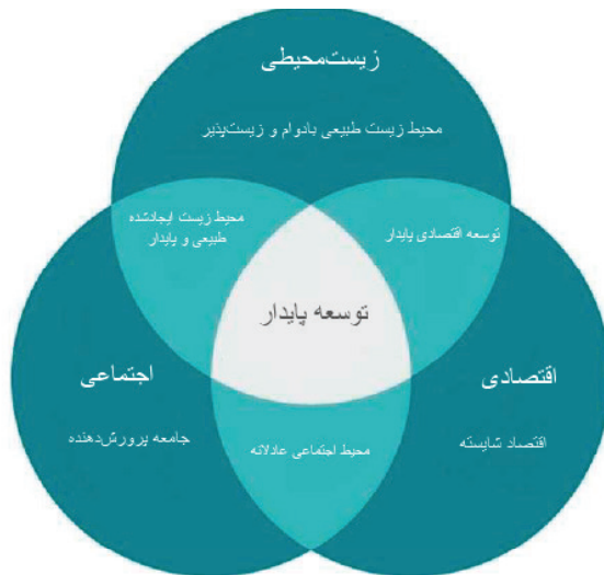
شکل ۱. شکل شماتیک مدل توسعه پایدار (شاکر و حسین ۱ ، ۲۰۱۸)

بعد اقتصادی در نظریه توسعه پایدار بر مبنای مفهوم رشد فراگیر شکل گرفته است، به‌گونه‌ای که علاوه بر ارتقای تولید ناخالص داخلی، توزیع عادلانه فرصت‌ها و درآمدها را نیز مد نظر داشته باشد (سولو، ۴۹۹۱). از سوی دیگر، بعد اجتماعی تحت تأثیر رویکرد توسعه انسانی آمارتیا سن قرار دارد که سرمایه انسانی و آزادی‌های بنیادین را شاه‌کلید رفاه می‌داند (سن، ۱۹۹۱). افزون بر آن، نظریه سرمایه اجتماعی رابرت پاتنام (۲۰۰۲) نشان می‌دهد پیوندهای اجتماعی و اعتماد عمومی، زیرساختی برای مشارکت مؤثر شهروندان در فرآیندهای توسعه است. بعد زیست‌محیطی در ادبیات اقتصاد پایداری، بر تداوم ظرفیت اکوسیستم‌ها تأکید دارد، به طوری که نرخ بهره‌برداری از منابع طبیعی نباید از نرخ تجدید آن فراتر رود (دالی، ۷۹۹۱). تلفیق این سه بعد، چارچوبی فراهم می‌آورد که ضمن در نظر گرفتن متقابل تأثیرات، امکان طراحی سیاست‌ها و مداخلات جامع و پایدار را میسر می‌سازد.